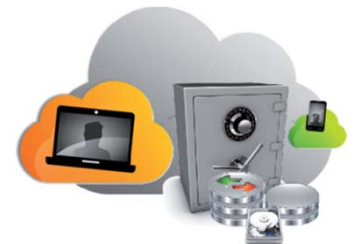
Enregistrement de vidéos sur le STOREX CLOUD SERVER