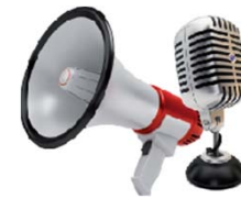
Micro / Haut-parleur intégrés