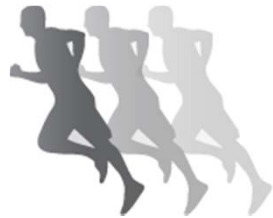
Détection de mouvements