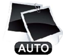
SnapShots (envoi de photos)