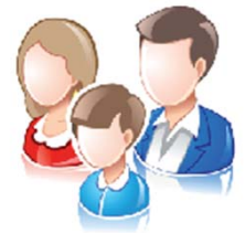
Partage de plusieurs caméras