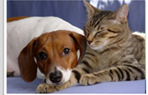
Votre animal de compagnie